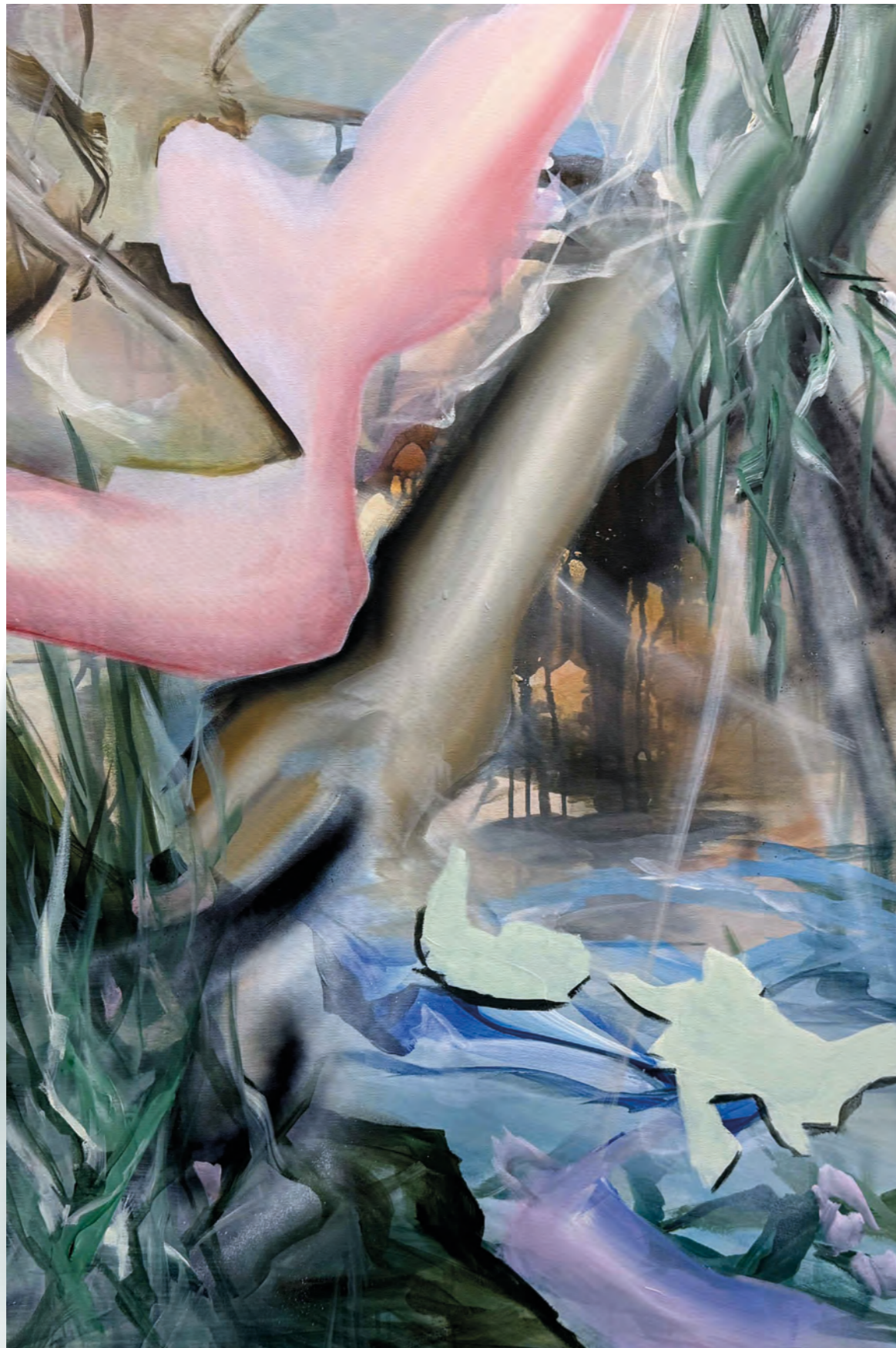
NEXT LEVEL 26-23476 Acrylic on canvas 80 x 120 cm 2026