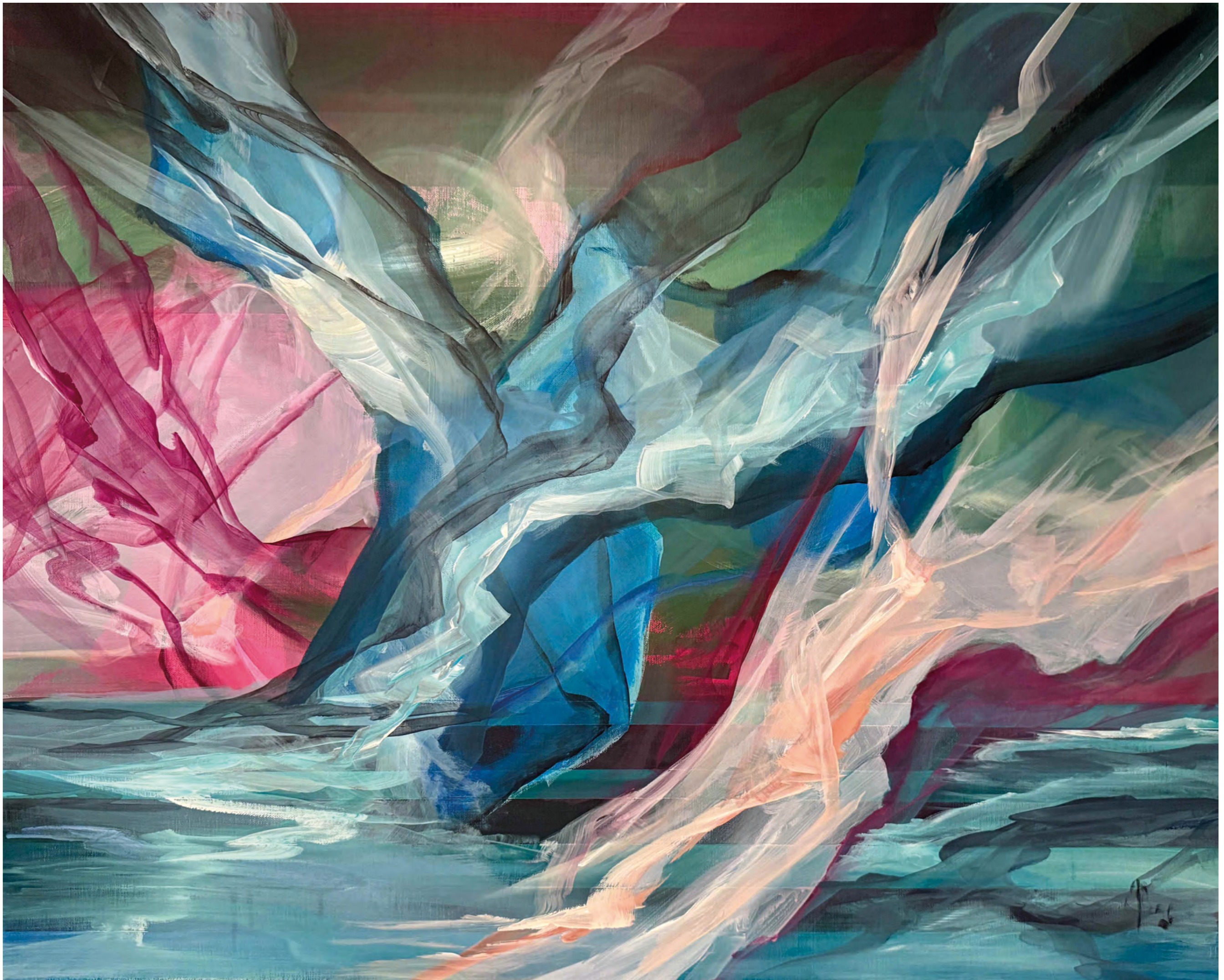
NEXT LEVEL JARDIN 26-14573 Acrylic on canvas 100 x 80 cm 2026