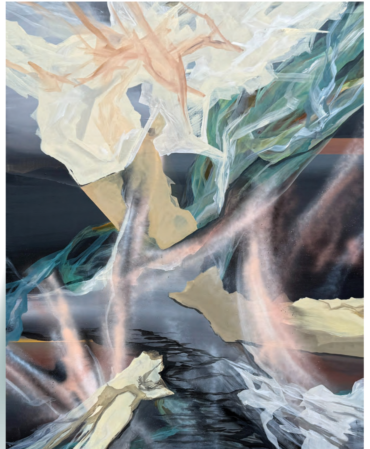
NEXT LEVEL 26-09301 Acrylic on canvas 80 x 100 cm 2026