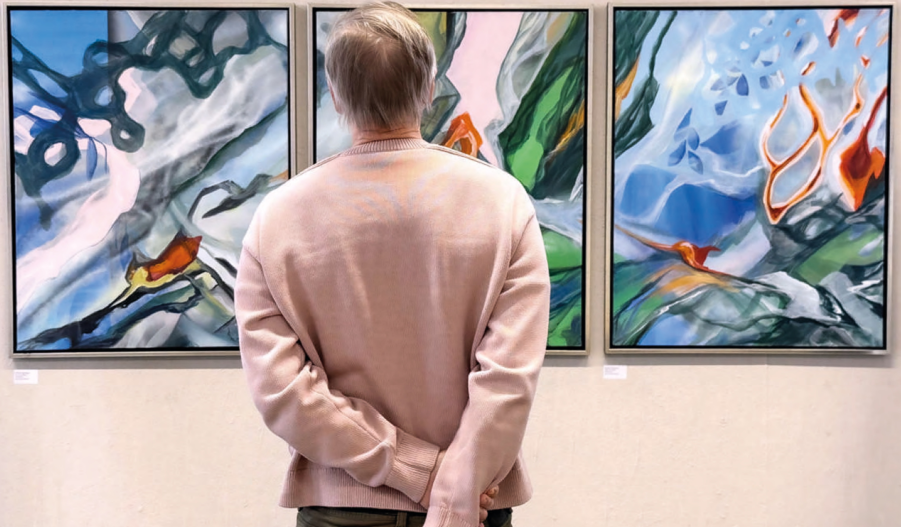
FLORA 26-28553, FLORA 26-13810, FLORA 26-24571, JE 80X100 (BXH), 2026, Links nach Rechts: Acrylic, Pigments on canvas