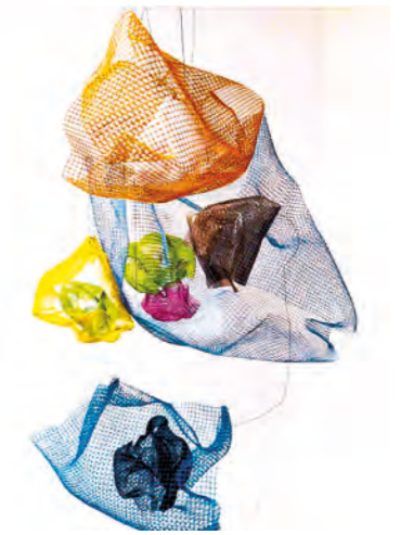
I FINITY CLOUD

Magnetized aluminum Dibond panels, acrylic, magnetized acrylic tiles, wood panels 80 x 80 cm 2025