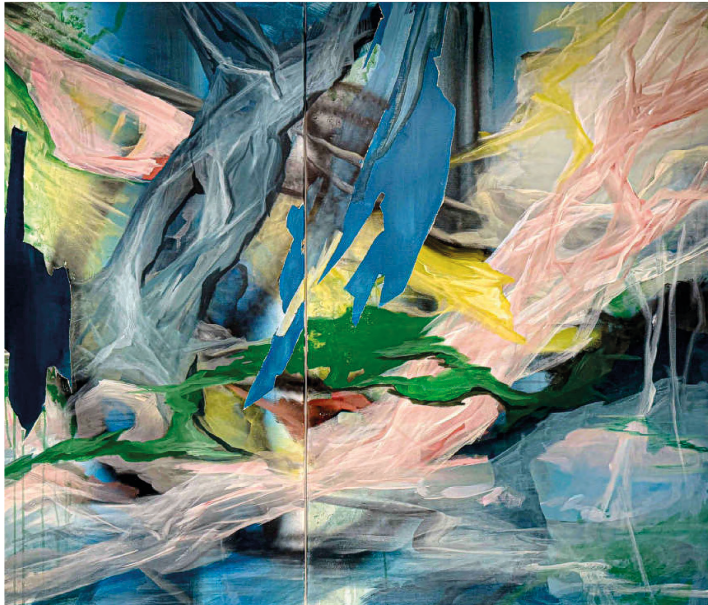
HISTORY WALL PAPER 26-481081