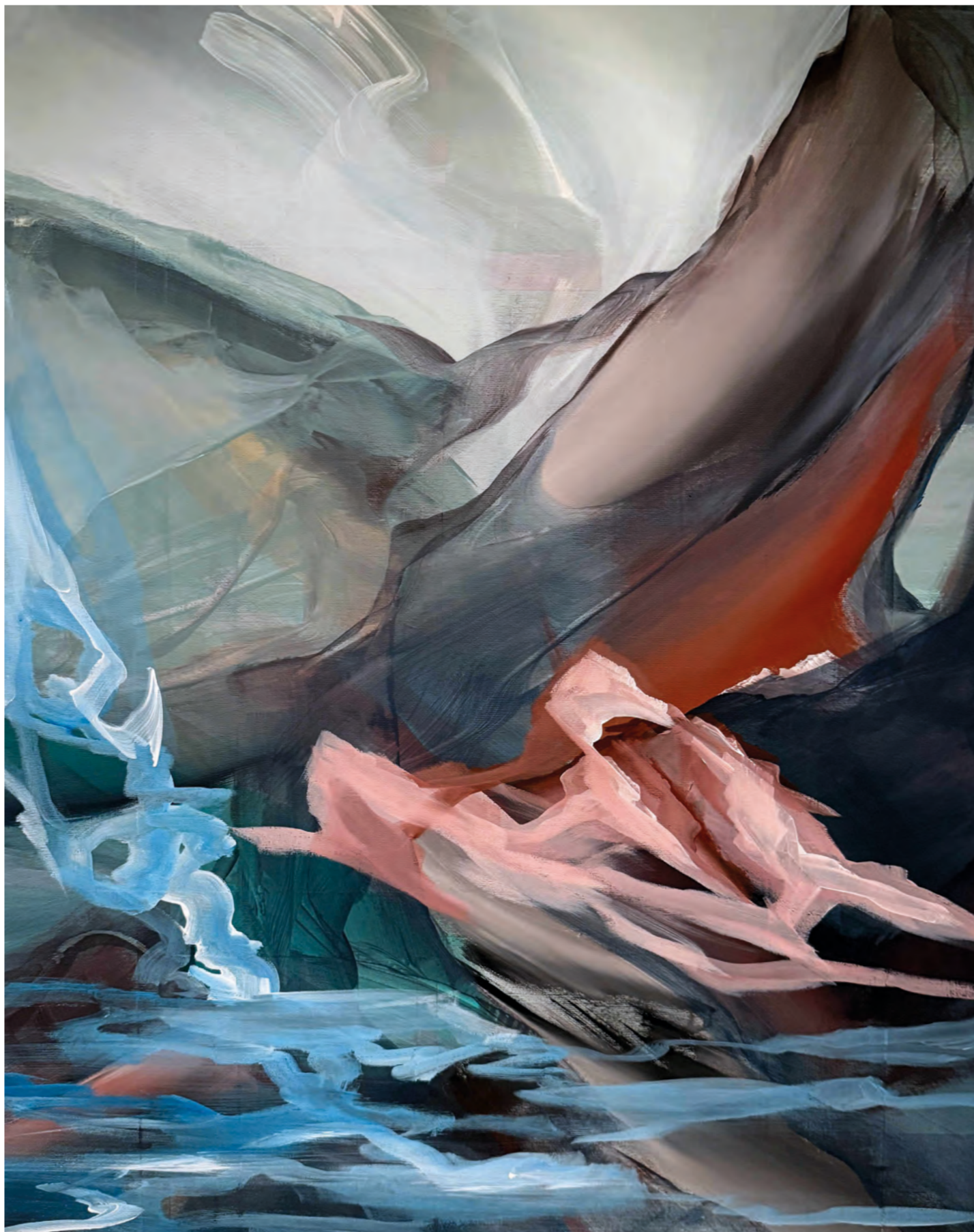
HISTORY NEXT LEVEL 26-41936