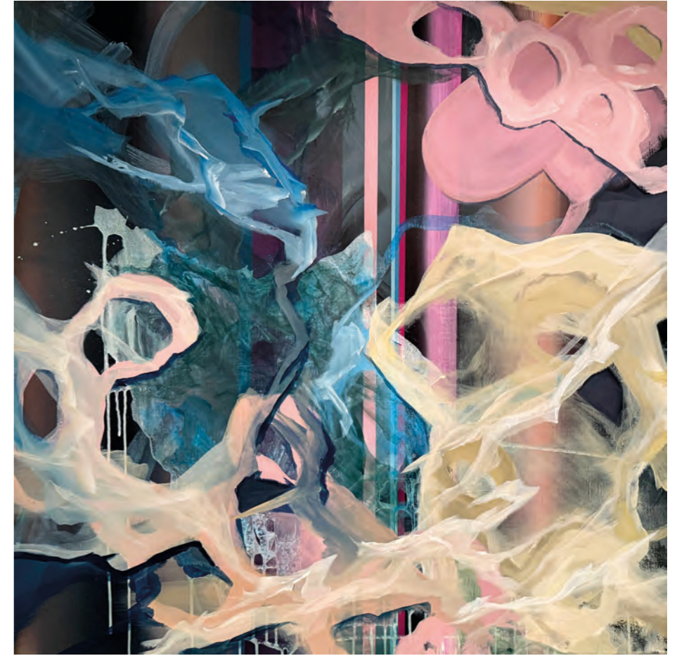
NEXT LEVEL JARDIN 26-21530