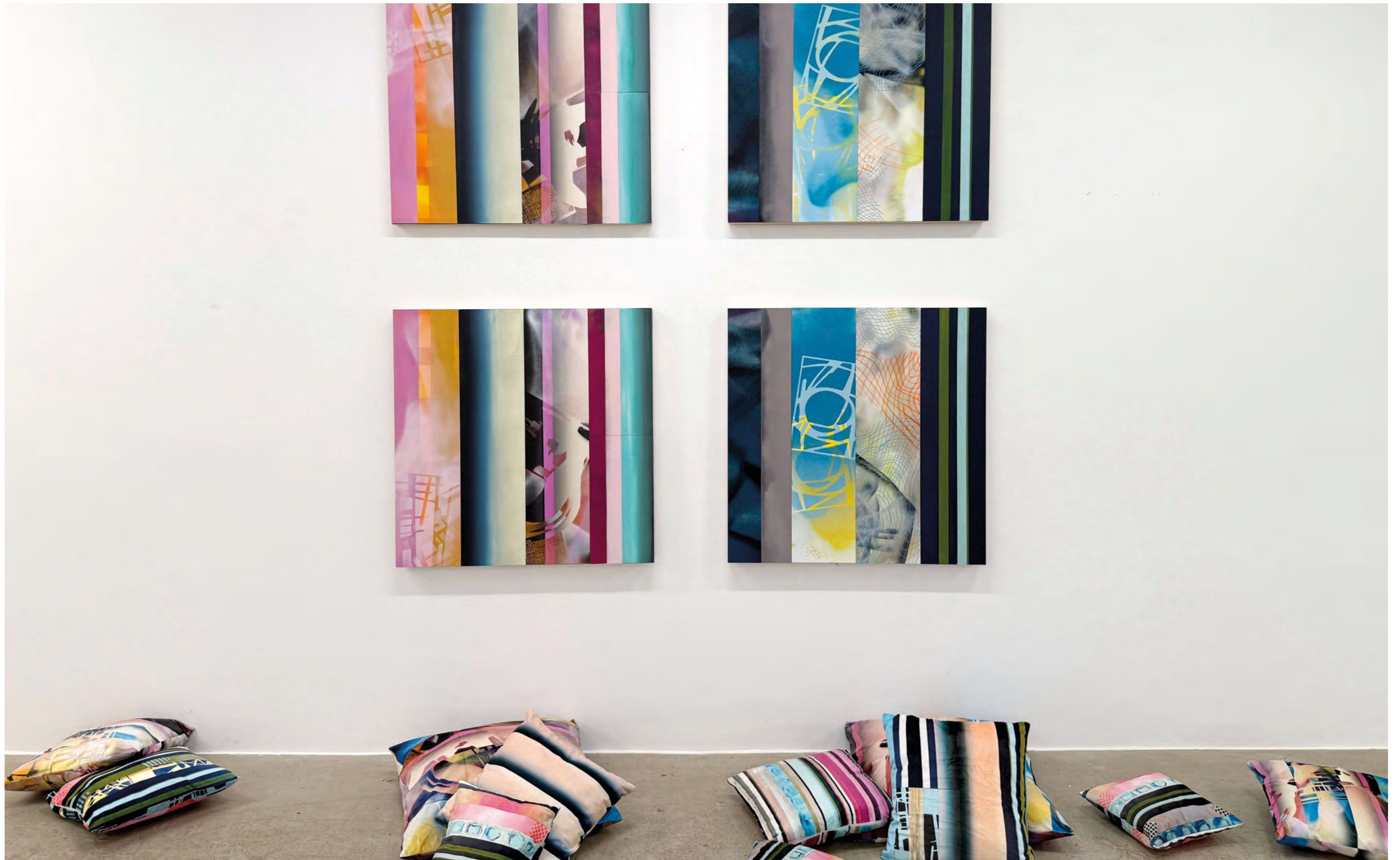
INFINITY INSTALLATION INCL. PILLOW DROPS