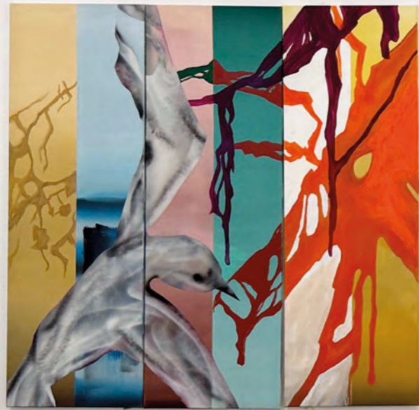
ANIMAL 25-20507 LOST IN SPACE , Triptychon, Acrylic, Pigments on canvas, 150x150cm, 2025