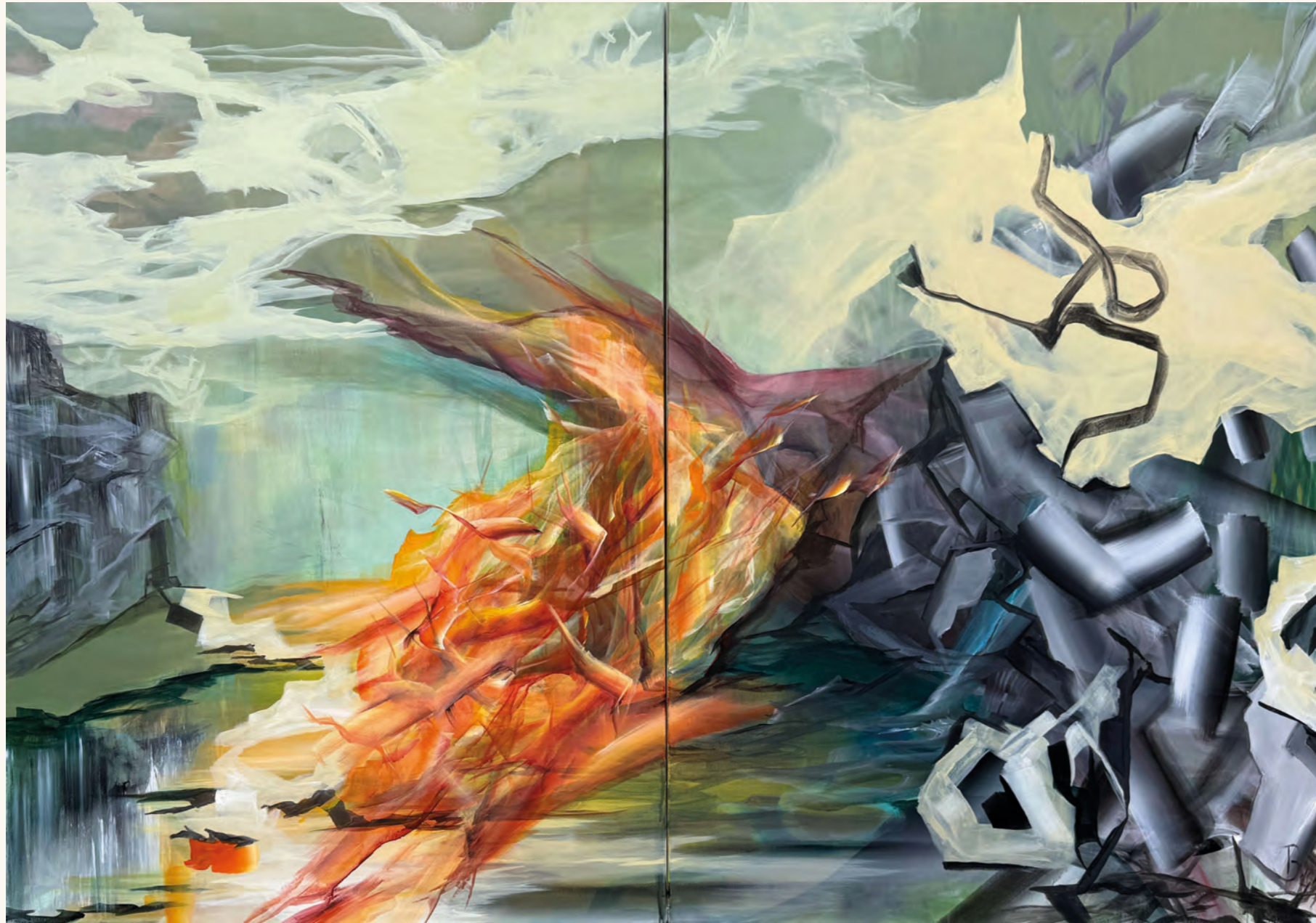
TIMELESS 26-09193 Acrylic on canvas 200 x 140 cm 2026